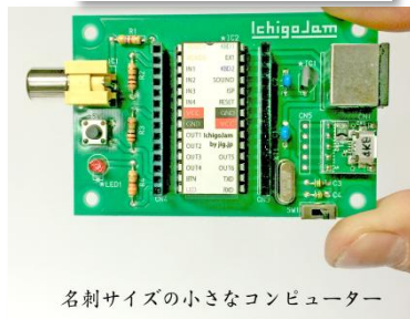
名刺サイズの小さなコンピューター